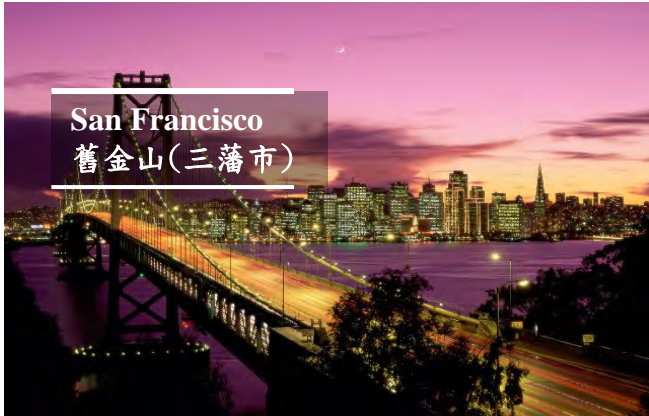
San Francisco 舊金山(三藩市)